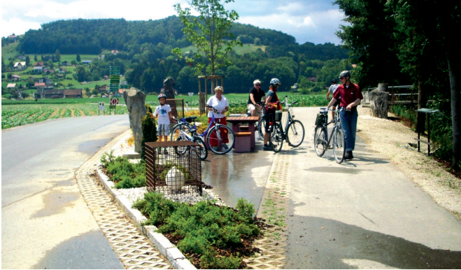
Kanufahren auf der Sulm und Radfahren auf dem Sulmtalradweg R1