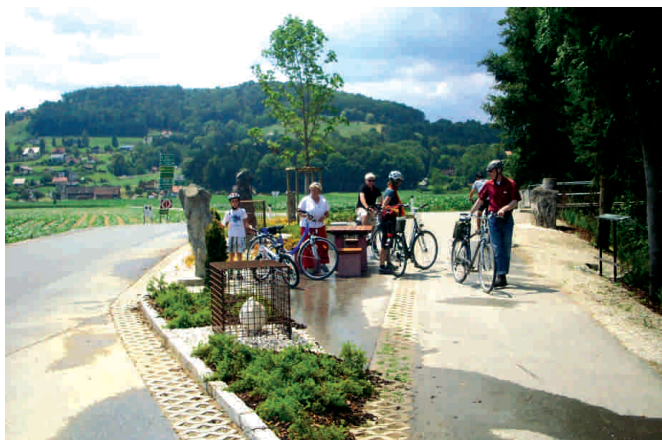
Kanufahren auf der Sulm und Radfahren auf dem Sulmtalradweg R1